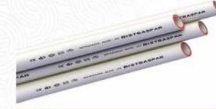
لوله سه لایه الیاف دار (PPRC)