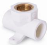
پایین تنه شیر فلکه