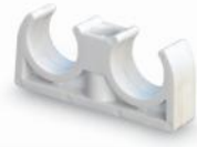
بست لوله دوقلو