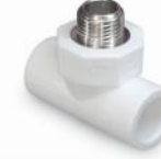
سه راه مغزی