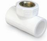
سه راه فلزی