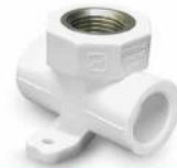
سه راه بستار