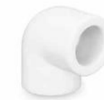
زانو ۹۰ درجه