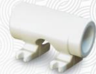
پل کوتاه بستدار