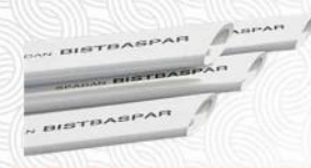
لوله سه لایه پلیمری