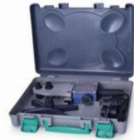
دستگاه اتو دوالمنت