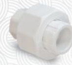
مهره ماسوره دوسرچوش