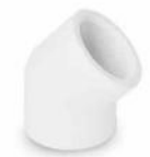
زانو ۴۵ درجه