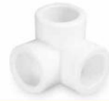
سه راه کنج