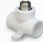
سه راه مغزی بستدار