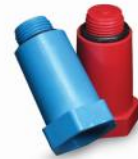
درپوش پایه بلند