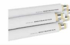
لوله پنج لایه جوشی