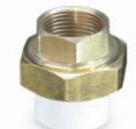
مهره ماسوره یکسر فلز